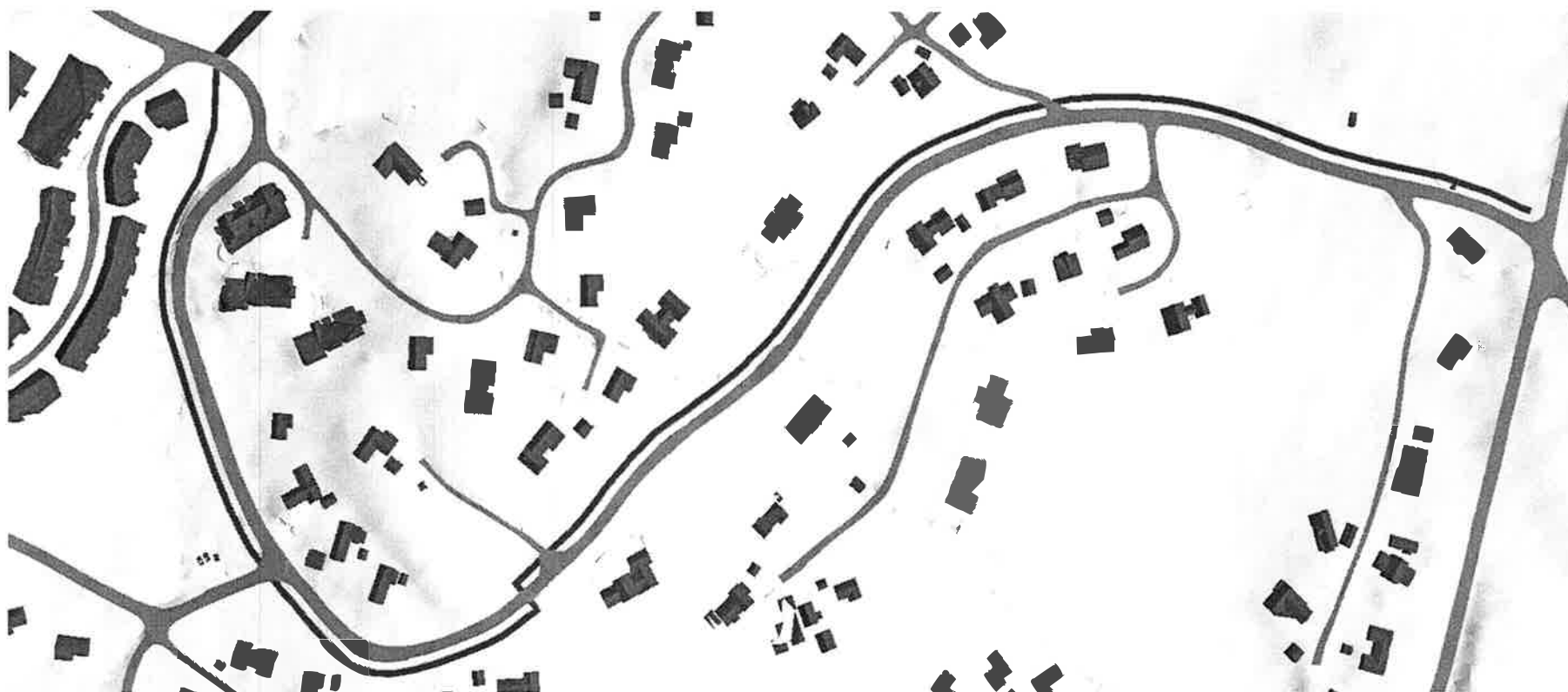
Alternativ opparbeidelse av gang/sykkelvei langs Lunnstadmyrvegen